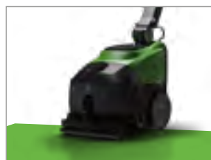
ZESTAW DO EKSTRAKЦИИ - OPCJA