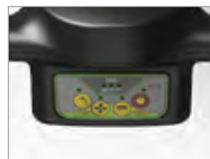
ZAPROGRAMOWANE TRYBY PRACY